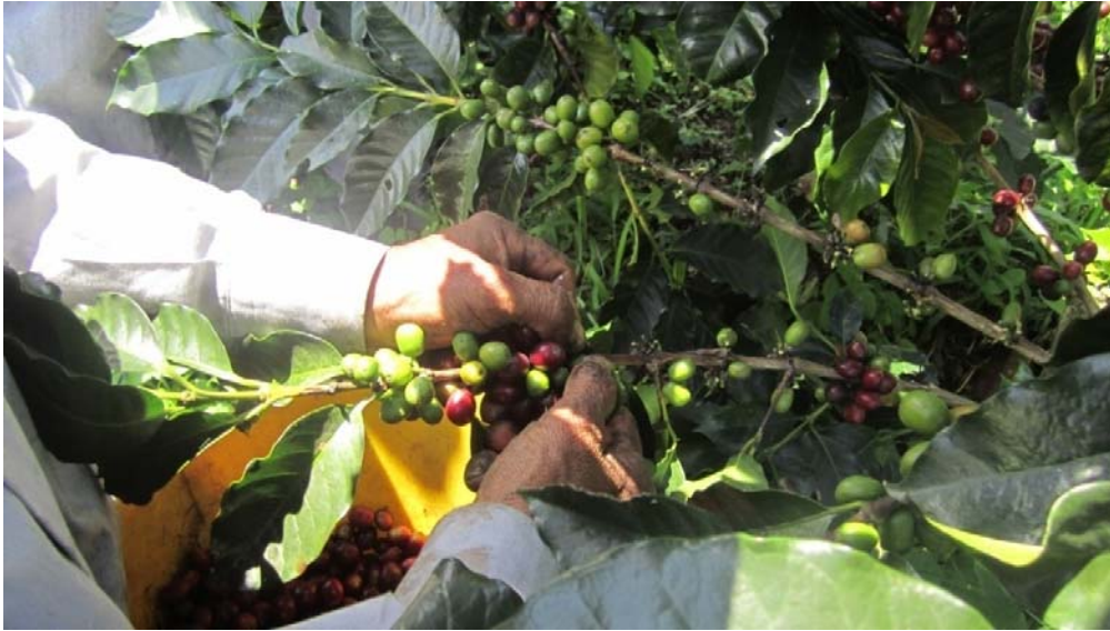
Figura 1. Sistema tradicional para la recolección manual de café

inclusión definidos. Cada recolector firmó el consentimiento informado para la participación en la investigación.