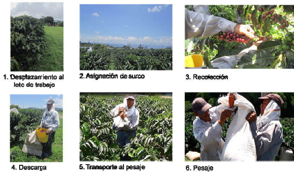
Figura 2. Elementos del proceso de recolección manual de café

El tiempo promedio de cada elemento del proceso de recolección, incluyendo el destinado a la alimentación, se presenta en la Tabla 1. Se presenta la participación tanto porcentual como en minutos por elemento en una jornada de trabajo; es evidente que la recolección es el elemento dominante en el proceso.